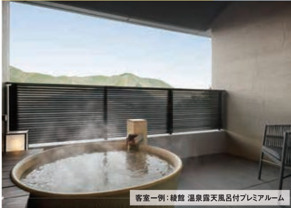
客室一例:綾館 温泉露天風呂付プレミアルーム

東京証券業健康保険組合加入の本人(被保険者)とその家族(被扶養者) (被保険者の3親等内の家族も会員料金でご利用いただけます。) ※詳しくは東京証券業健康保険組合ホームページをご参照ください。